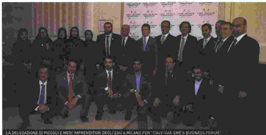
LA DELEGAZIONE DI PICCOLI E MEDI IMPRENDITORI DEGLI EAU A MILANO PER "ITALY-UAE SME'S BUSINESS FORUM"

importazioni dall'Italia, rappresentano un'opportunità irrinunciabile, tanto più a un anno dall'inizio di Expo 2020 Dubai, un evento globale a cui parteciperanno oltre 200 Paesi, con oltre 25 milioni di visitatori, e le cui entrate stimate superano i 20 miliardi di euro. Per questo l'Italy - UAE SME's Business Forum era anche una ghiotta occasione per le Pmi italiane interessate ad internazionalizzare le proprie attività negli Emirati Arabi Uniti. L'opportunità è stata colta da oltre 200 imprenditori e manager di Pmi italiane, che oltre a partecipare al forum hanno preso parte anche a un'ampia sessione di incontri BtoB, dove hanno potuto interloquire direttamente con la delegazione emiratina e valutare concrete opportunità di business. Tra le numerose aziende presenti figuravano Versace Home, Missoni, Genny, Isaia, Bulgari, Buccellati, Moreschi, Peck, Ristorante Savini, Lidia Cardinale, Trussardi, Aran, Feinrohren, Ambienthesis, Tecnomec, Gewiss, Ave, Immobiliare Percassi, Moretti Costruzioni, HRC, Ernst & Young, Università Cattolica del Sacro Cuore, Fondazione Policlinico, IEO. All'Italy - UAE SME's Business Forum ha partecipato anche il più importante gruppo bancario italiano. «Per esseri concreti c'è anche Intesa Sanpaolo, l'unica banca italiana ad avere la licenza per operare nella valuta degli Uae» ha spiegato il presidente di Efg Consul-